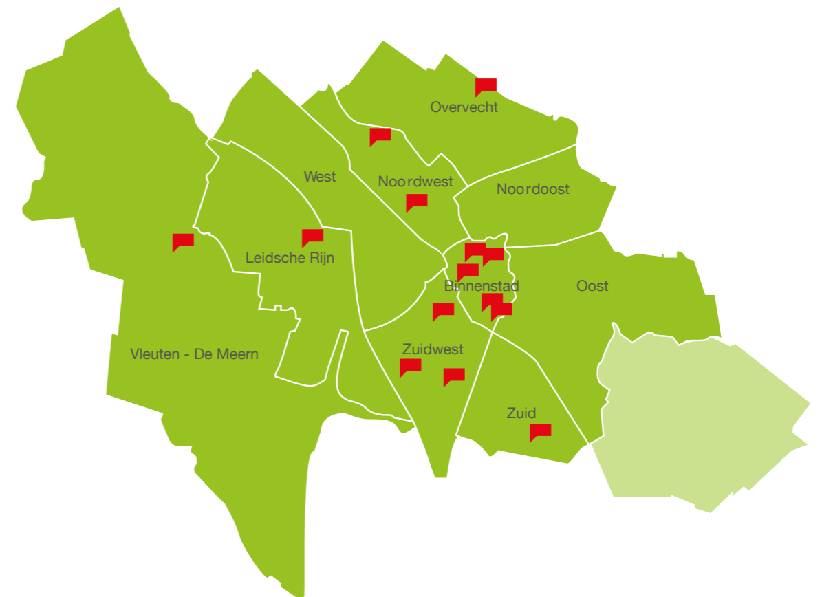
De locaties waar de coalitiebesprekingen plaatsvonden.